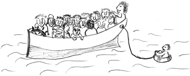
Abbildung 1: Alle Teilpersönlichkeiten sitzen in einem Boot – und doch ist jede anders 83

Nicht zu verwechseln sind Persönlichkeitsanteile mit Persönlichkeitsstörungen. Letztere sind ein psychiatrisches Störungsbild, mit welchem Eigenschaften einer Person beschrieben werden, die so starr und unflexibel sind und gleichzeitig so deutlich von „normalen“, also durchschnittlichen Eigenschaften abweichen, dass sie zu einem Leidensdruck führen.